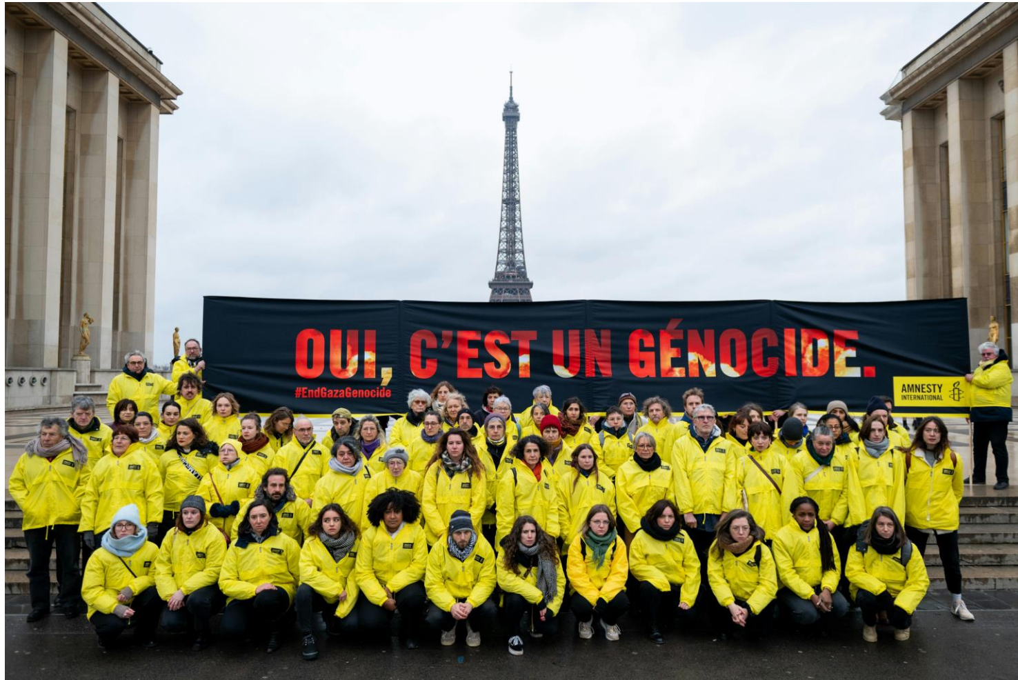
Action Gaza « Oui c'est un génocide », à Paris (Parvis des droits de l'Homme), le 09/12/24.